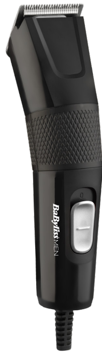
Made in China Fabriqué en Chine E756E - T156a